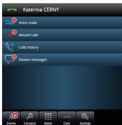
我的即时通中小企业网页版首页

越来越多的员工通过使用合适的设备使工作变得更加灵活，通过合适的服务，实现最大效率。移动性就是其中一个关键，通过它，用户可以与公司保持紧密联系，确保业务连续性。阿尔卡特朗讯 8600 我的即时通中小企业网页版应用专为中小型企业 (SMB) 而设计。它提供完全基于浏览器的应用，能够帮助员工大幅提升工作效率，该应用将员工连接到公司的阿尔卡特朗讯 OmniPCX Office™ RCE 通信服务器，通过易于使用的界面提供通信服务。